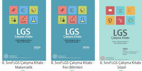
8. Sınıf LGS Çalışma Kitabı - Matematik 8. Sınıf LGS Çalışma Kitabı - Fen Bilimleri 8. Sınıf LGS Çalışma Kitabı - Sözel