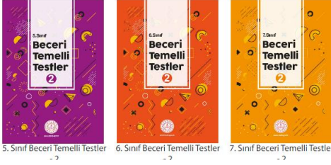
5. Sınıf Beceri Temelli Testler 6. Sınıf Beceri Temelli Testler 7. Sınıf Beceri Temelli Testler